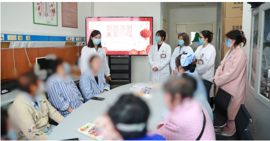
“学雷锋”斯凯洛斯关爱小组进病房送温暖

本报讯（通讯员 高婧雯）今年是毛泽东同志为雷锋题词并发出“向雷锋同志学习”号召61周年。为深入学习宣传党的二十大精神，进一步贯彻落实习近平总书记关于弘扬雷锋精神的重要指示，持续深化虹口区新时代文明实践和学雷锋志愿服务工作，弘扬“奉献、友爱、互助、进步”的志愿服务精神，上海市中西医结合医院的党员志愿者、共青团员、医疗业务骨干等积极组织了各项学雷锋志愿服务活动。通过实际行动，向社会传递着关爱与温暖，展现着医务工作者的责任与担当。