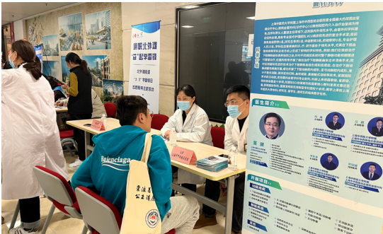
“学雷锋”进楼宇，健康走进你身边