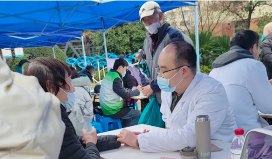
“学雷锋”进社区，健康常伴你左右