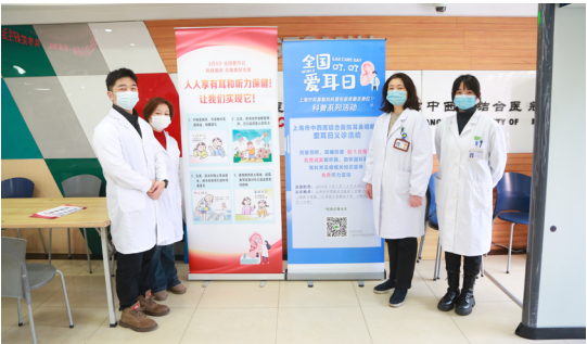
“爱耳日”听力健康咨询活动