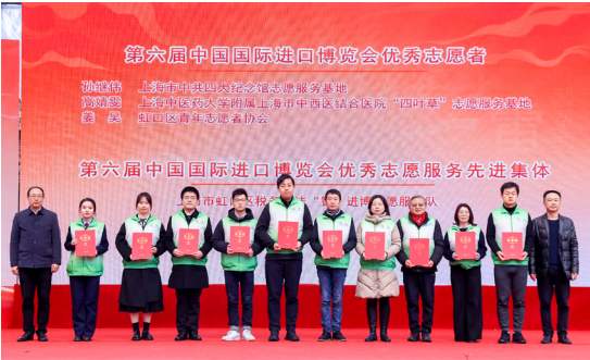
虹口区3.5学雷锋文明实践志愿服务活动